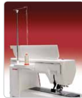
Trådstativ (för stora trådrullar)