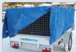
Kapell till nätgrind