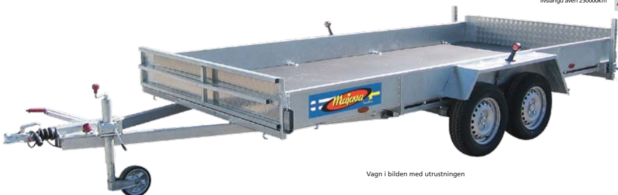
Vagn i bilden med utrustningen